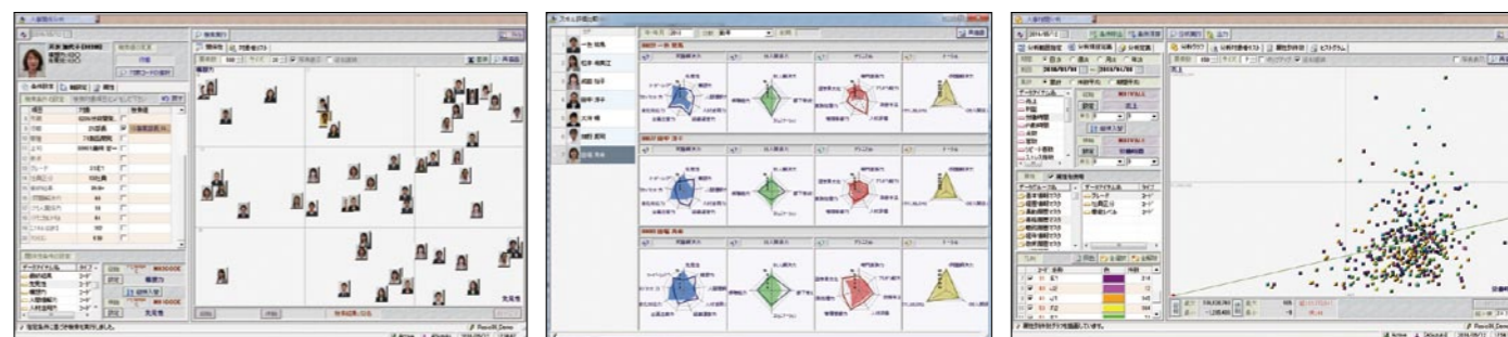
■エグゼクティブインターフェース:

簡易かつ直観的な操作ができるユーザーインターフェースを提供。任意のグリッドで人材をマッピングし、ドリルダウンすることが可能です。